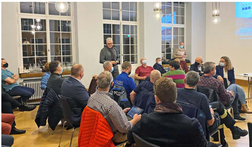
Treffen des OK Zug.

Deborah Annema, Text; Bilder zVg Vom 16. bis 18. Juni 2023 wird die Stadt Zug Gastgeberin des Eidgenössischen Jodlerfestes sein. Unter dem Motto «traditionell – überraschend – vielseitig» wird drei Tage lang musiziert, gesungen und die Fahnen geschwungen.